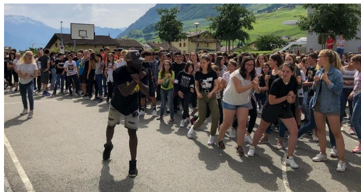
Nadia und Dakota mit der Orientierungsschule Leytron

Insgesamt haben kantonal über 150 Klassen teilgenommen und die Ausdauer bewiesen, das Rätsel zu lösen. Dies wurde nun belohnt! Die ersten beiden Plätze belegten Klassen von der Orientierungsschule Leytron. Im Rahmen dieser Preisverleihung kam die Siegerschule in den Genuss einer « aktiven Pause ». Nadia und Dakota, das Tanz-Duo aus der Show "La France a un incroyable Talent", brachten die Schülerinnen und Schüler zum Tanzen. Das Thema häusliche Gewalt wurde in Verbindung zu Abhängigkeit gebracht und griff zugleich den Tag des nationalen Frauenstreiks auf.