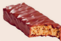
Barre de céréales