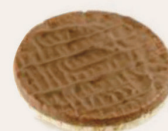
Galette de riz au chocolat