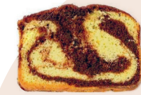
Tranche de cake