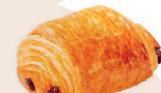
Pain au chocolat