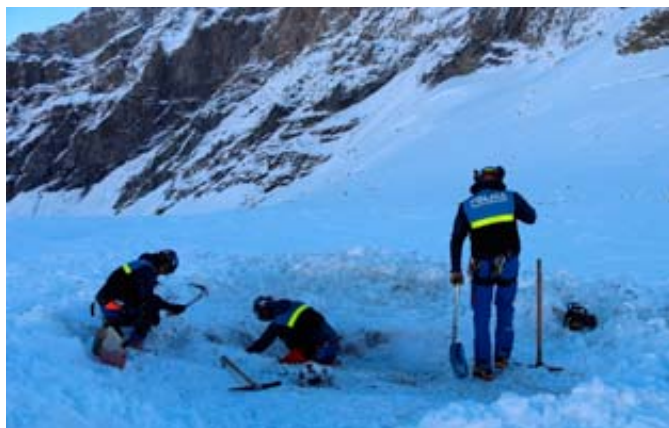
Les ossements ont été retrouvés en septembre 2022 sur le glacier de Corbassière.